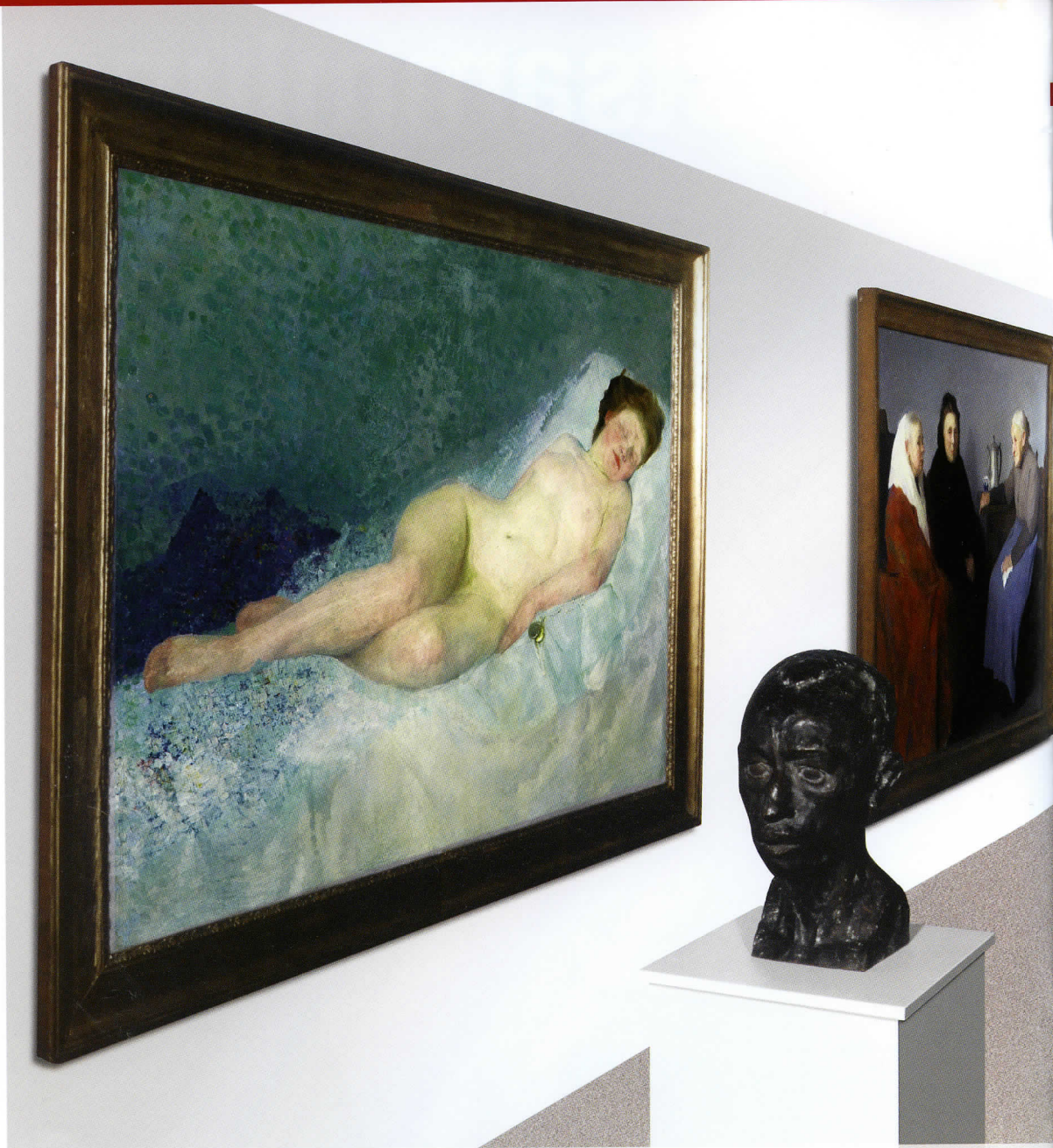
Kunstsammlung Friedrich Karl Ströher im Neuen Schloss zu Simmern