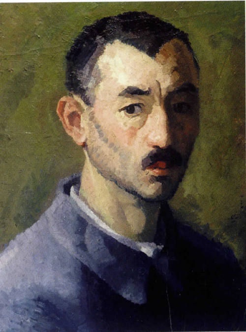
Selbstportrait mit blauer Jacke, Berlin um 1916