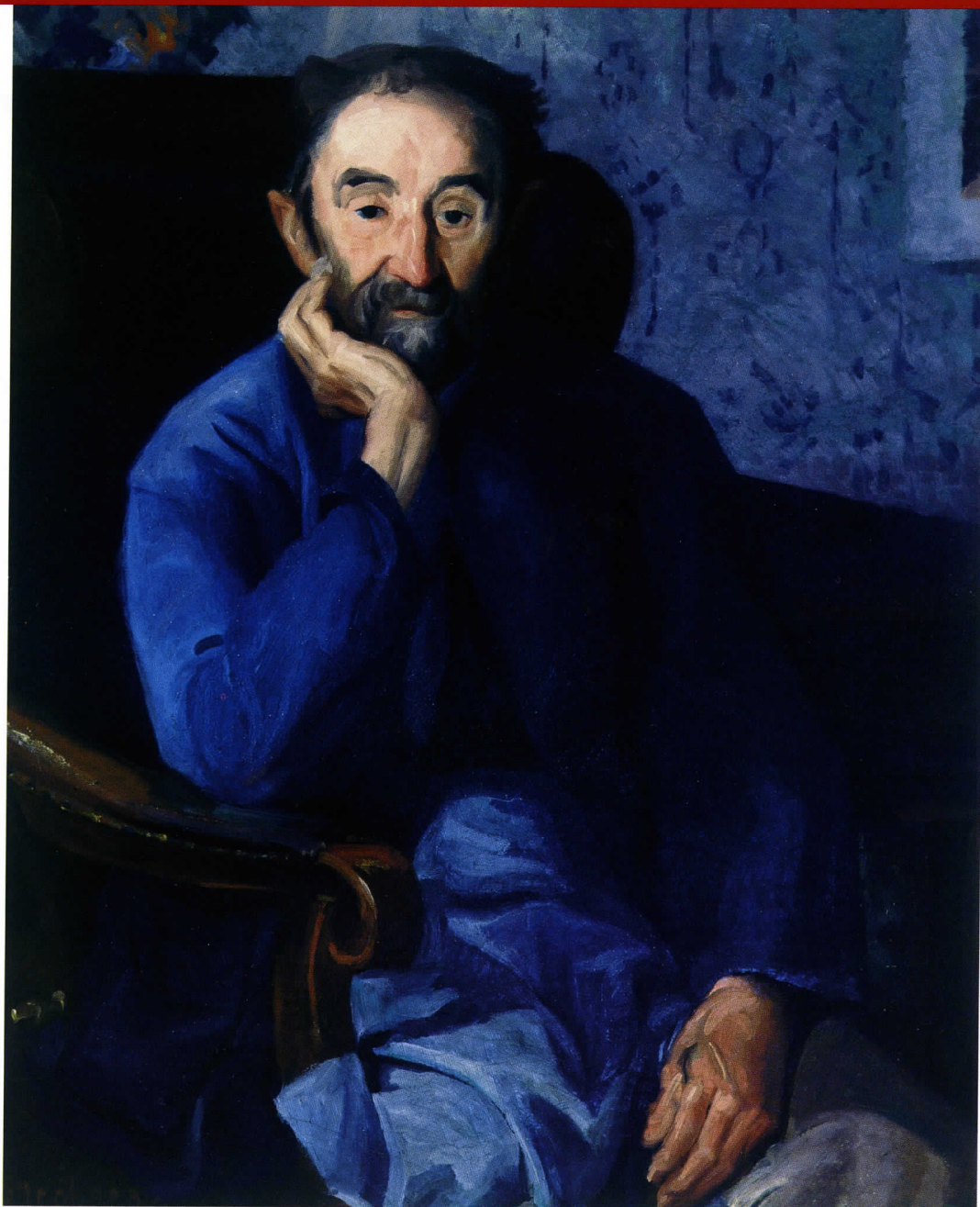
Mein Vater in blauer Jacke, Berlin 1920